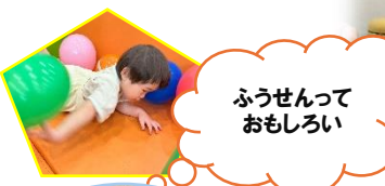
ふうせんって おもしろい