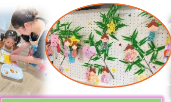
たなばたそうめんつくり