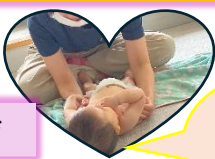
ママの手って 気持ちいい!