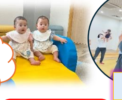
えほんうたあそび・ねんね赤ちゃん