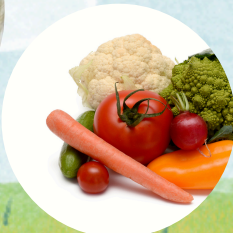
とれたて野菜販売