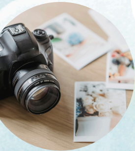
ポートレート撮影

lepepinのお菓子お弁当・栄養士さん手作り軽食 matsurikaさんのハーブとフルーツのジュース marsurikaさん・Ecruさんのワークショップ フォトグラファーのワンコインポートレート撮影 とれたてのお野菜販売など 楽しいお店が大集合